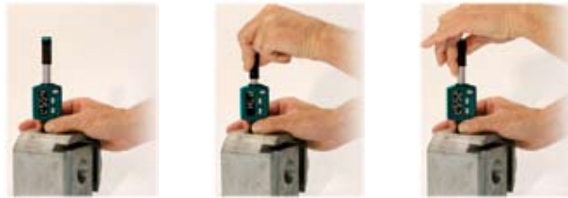
1. Appliquer 2. Armer 3. Mesurer